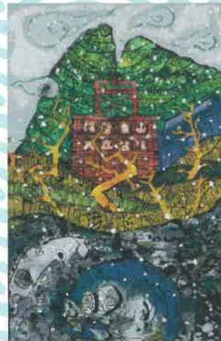
同 新潟県知事賞 静岡県立伊東高等学校城ヶ崎分校「幻影」

主催: 全国高等学校版画選手権大会実行委員会 共催: 佐渡市・(一社)佐渡版画村 〒952-1592 新潟県佐渡市相川栄町27 佐渡市役所相川支所内 TEL: 0259-74-3111 FAX: 0259-74-2551