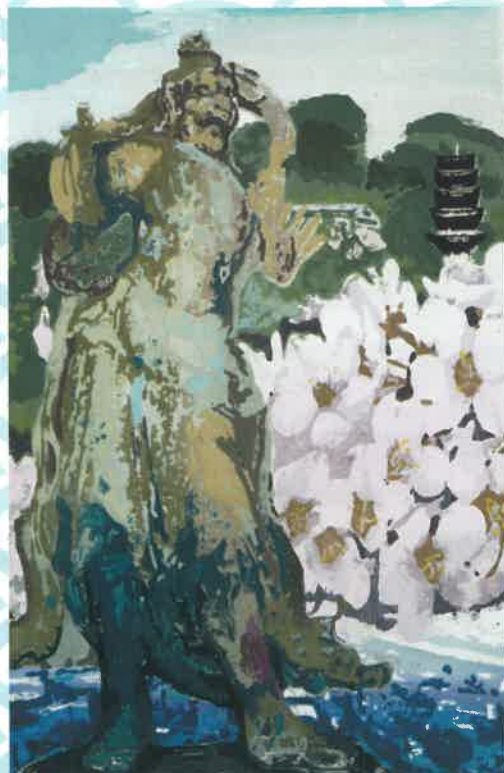
同 中小企業庁長官賞 広島市立沼田高等学校「春の訪れ」