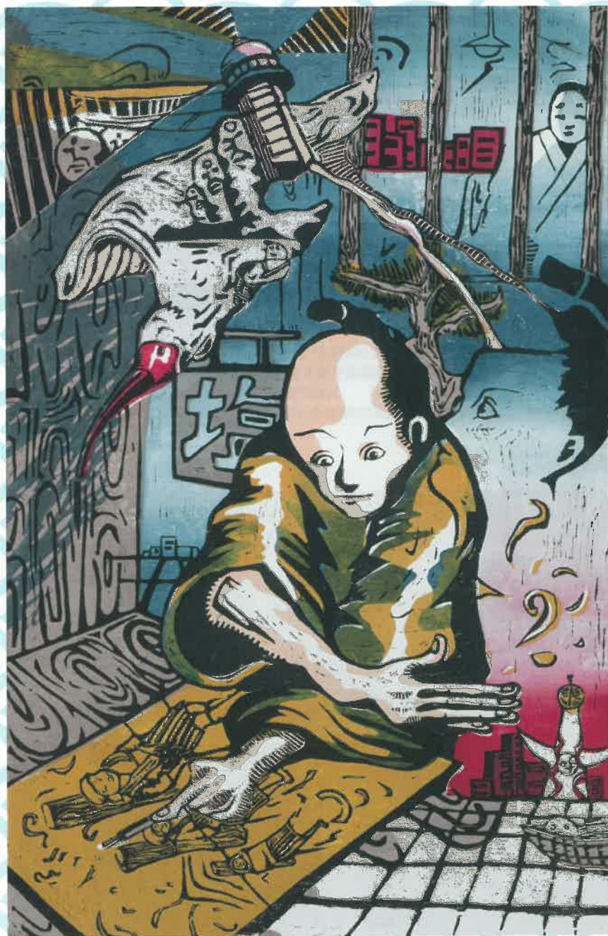
第21回大会 文部科学大臣賞 大阪府立港南造形高等学校「トキ渡り」

本戦: 令和4年3月17日(木)~21日(祝・月) 会場: 佐渡市あいかわ開発総合センター・佐渡市相川体育館(予定)